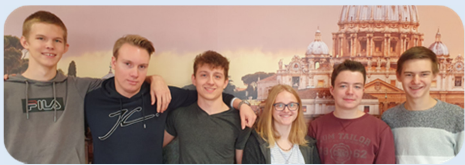
Aus unserem Schülerhelferteam: